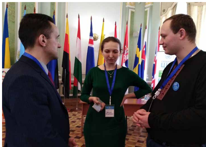
Керівникам учнівських делегацій також було про що поспілкуватися

Я вважаю, що молодь зараз повинна цікавитися і займатися політикою, зокрема беручи участь у такого типу заході. Все дуже просто. Якщо ви не будете займатися політикою - політика буде займатися вами. І на сьогоднішній день, на жаль, оця політика займається в тому числі і молоддю дуже й дуже погано. Тому, звичайно, молодь повинна займати таку активну громадянську позицію і повинна сама «входити» в політику і сама її створювати. Звичайно, для цього треба старші люди, більш досвідчені, щоб вас правильно направляли, але і від вашої активної життєвої позиції багато що залежить.