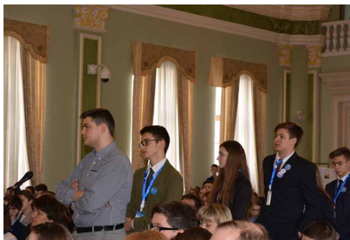
Делегати конференції ставлять запитання дипломатам