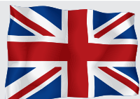
Сполучене Королівство Великої Британії та Північної Ірландії