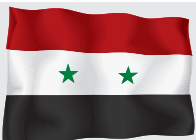
Сірійська Арабська Республіка